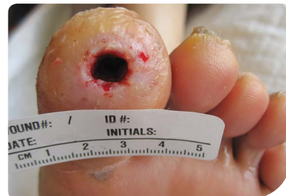
SNAP™ terapijos pradžia

Patikrinamojo vizito metu praėjus vienai savaitei po ląstelinio audinio gaminio aplikacijos, stebėta visiška opos epitelizacija. Pacientas stebėtas du mėnesius, ilginant laiką tarp apsilankymų, opa išliko užgijusi.